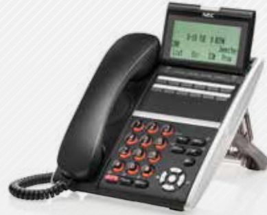
DT430 & DT830