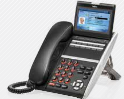
DT830CG Color Display