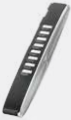
8 li Ek Tuş Modülü