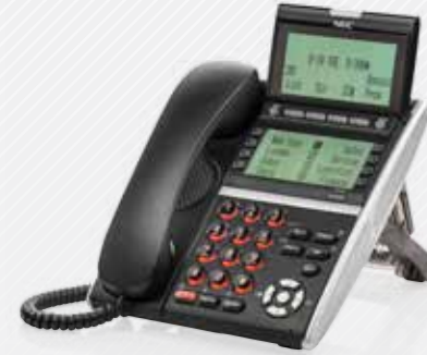
DT430 & DT830 Dual Display (Desi-less)