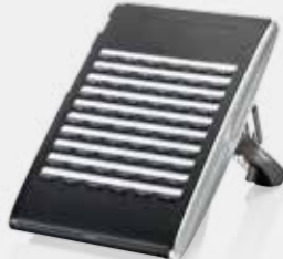
60 lı DSS Konsol